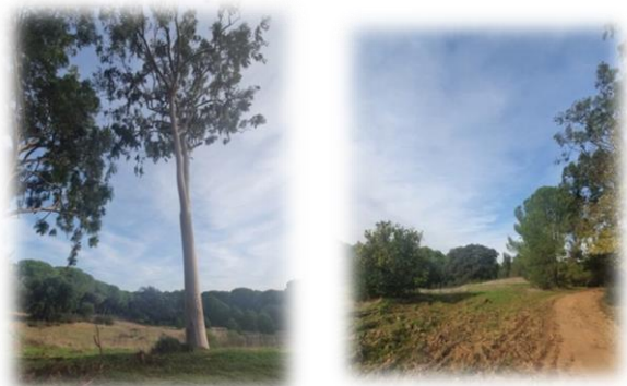
“Eucalyptus citriodora junto al descansadero del Colmenar”

Cruzando este maravilloso pinar y disfrutando de la naturaleza, llegamos a un gran claro en mitad del pinar, son los terrenos de la antigua Casa de El Colmenar, dónde sólo han llegado a nuestros días varios árboles frutales y una gran explanada sin rastro alguno del bonito edificio que era.