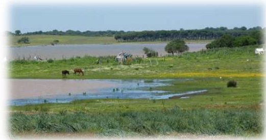
"Laguna de la Rianzuela"