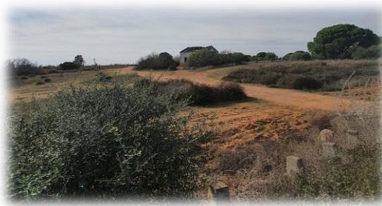
“Casa de las Trescientas”

Siguiendo la pista durante unos kilómetros llegaremos a la Casa de las Trescientas.