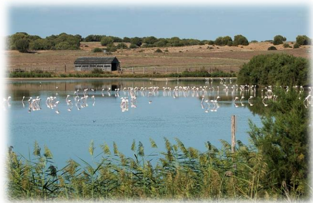
"Observatorio de aves (Dehesa de Abajo)"

Para los amantes de la naturaleza, tendremos la posibilidad de observar desde pasarelas de madera las diferentes especies que habitan en la zona.