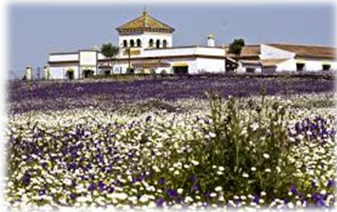
“Suelo tapizado por margaritas”

A medida que avanzamos sobre nuestro itinerario, nos encontraremos con una serie de lagunillas dependiendo de las estaciones del año, que se pueden crear debido a las precipitaciones. Pueden tener agua desde el otoño hasta finales de primavera, pudiendo disfrutar de especies vegetales y singulares. Esto hace que desde finales del invierno, florezcan extensos prados de margaritas, tapizando el suelo de blanco.