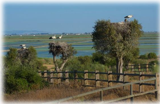
"Cigüeñas sobre acebuchales"

Desde tener uno de los acebuchales mejor conservado de toda la provincia de Sevilla, sobre el que además anida la mayor colonia de cigüeña blanca a escala nacional, hasta la Laguna de la Rianzuela, masa de agua de gran interés para la avifauna y que ha sido inteligentemente ganada al terreno y a las circunstancias, represando para ello el estacional curso del Arroyo de Majalberraque, poco antes de su desembocadura en el Brazo de la Torre.