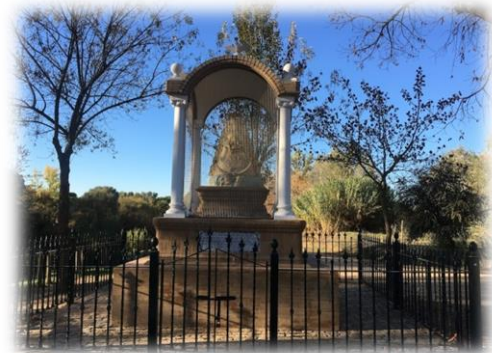
“Temple de la Virgen del Rocío en el Vado del Quema”

El Vado del Quema es muy conocido popularmente, por ser paso obligado de gran cantidad de peregrinos que, acompañando a sus hermandades, acuden cada año en peregrinación a la ermita de El Rocío, para rendir pleitesía a La Señora.