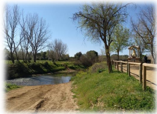
“Vado del Quema”

Continuamos hacia delante y coincidiremos con la intersección del Cordel del Camino de los Playeros y de la Cañada Real de los Isleños, ambas vías pecuarias deslindadas. En este mismo punto, podremos observar, al fondo, la explanada junto al Vado del Quema, con su templete de la Virgen del Rocío.