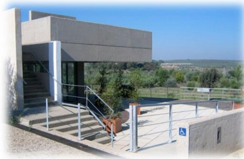
“Centro de Visitantes Guadiamar”

Para empezar nos dirigimos por caminos hasta la localidad de Aznalcázar, dónde visitaremos algunos monumentos de interés y seguiremos nuestro camino desde el Centro de Visitantes del Río Guadiamar/Corredor Verde.