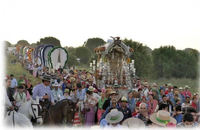
“Paso de las Hermandades por el Vado del Quema”

En este lugar descansaremos y almorzaremos con catering todo incluido.