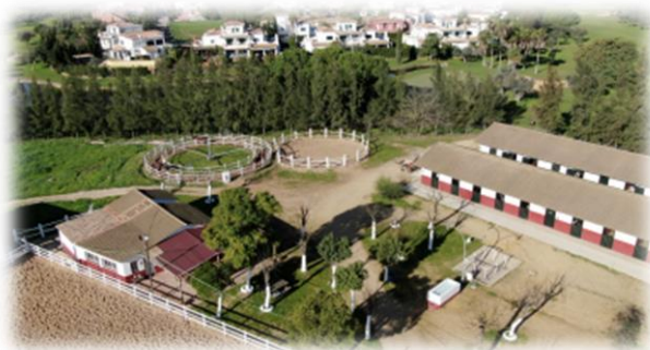
“Instalaciones Hípica Las Minas”

Esta ruta comienza en las instalaciones de Hípica Las Minas junto al campo de Golf “Las Minas Aznalcázar”- Sevilla.