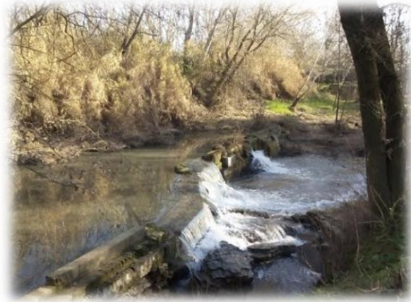
“Molino de la Patera”

Recorridos unos kilómetros, el camino nos conduce a las ruinas del Molino de La Patera,